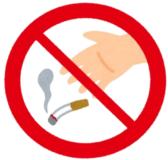
指定場所以外での 喫煙