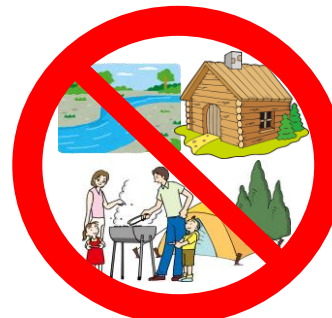
火気使用 建物内、羽束川、テントサイト 山林及びバンガロー付近不可