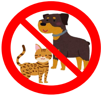
ペット同伴 盲導犬、介助犬可