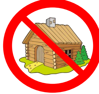
宿泊施設(建物内) 飲食