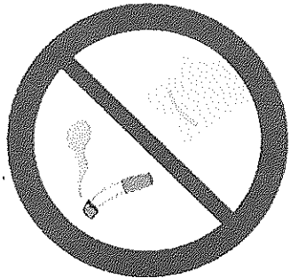
指定場所以外での 喫煙