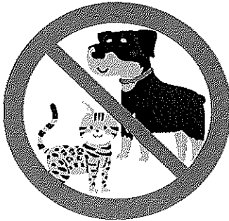
ペット同伴 盲導犬、介助犬可