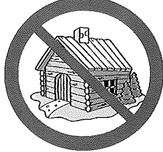
宿泊施設(建物内) 飲食