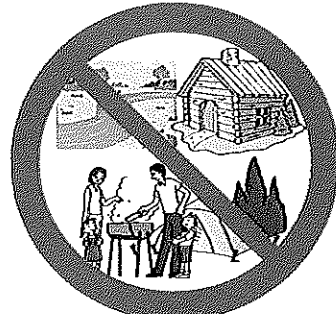
火気使用 建物内、羽束川、テントサイト 山林及びバンガロー付近不可